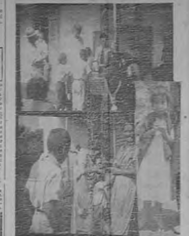
Tres interesantes instantáneas de los trabajos de sanidad que se efectúan en el distrito de Las Pavas, y de la cual damos amplia información

La Cera Merciolizada es un producto que conserva el cutis impecable, ayudando a mantener la piel sana y protegida. Este producto es muy popular entre quienes buscan mantener su piel en las mejores condiciones. La Cera Merciolizada es un producto que conserva el cutis impecable, ayudando a mantener la piel sana y protegida. Este producto es muy popular entre quienes buscan mantener su piel en las mejores condiciones. La Cera Merciolizada es un producto que conserva el cutis impecable, ayudando a mantener la piel sana y protegida. Este producto es muy popular entre quienes buscan mantener su piel en las mejores condiciones.