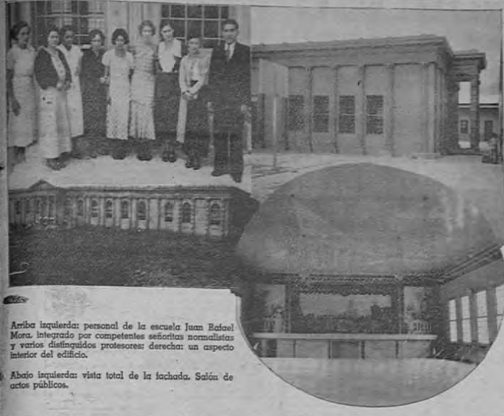
Arriba izquierda: personal de la escuela Juan Rafael Mora, integrado por competentes señoritas normalistas y varios distinguidos profesores; derecha: un aspecto interior del edificio.

Con capacidad para alojar a más de 700 alumnos cuenta el elegante edificio