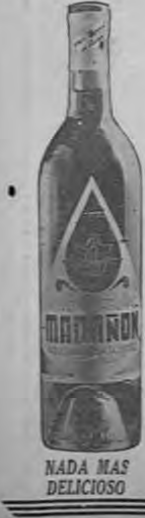
NADA MAS DELICIOSO

PRINCESS PAT, L.T.D. CHICAGO • TORONTO • LONDRES